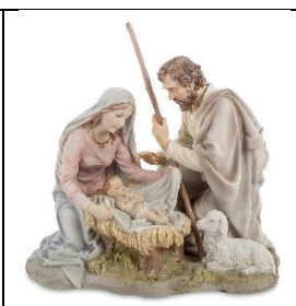
Б) Рождество Христово